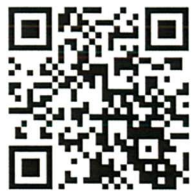
凱暉 Facebook QR code

簡介：為每間大專院校提供2次生命教育攤位，透過攤位遊戲宣傳生命教育的知識，並於現場擺設展板提供生命教育的相關資訊。